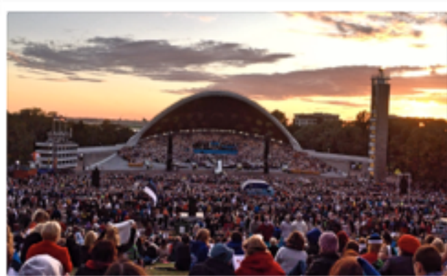
LAULUVÄLJAK, SIÈGE DU DÉBUT DU MOUVEMENT EN ESTONIE

d'Estoniens se sont réunis au Lauluväljak , l'arène officielle du "Laulupidu" (grand festival de chant à Tallinn). Pendant plusieurs soirs de suite, les Estoniens se retrouvent pour chanter ensemble un répertoire de chants patriotiques dans leur propre langue, ce qui à l'époque était illégal. Des rassemblements similaires ont lieu en Lettonie au Vispārējie latviešu Dziesmu un Deju svētki , festival de chant et de danse à Riga. En Lituanie, un groupe de musique postmoderne aux influences punk/ska et rock organise un festival, le "Roko maršas" (marche du rock), avec pour idée de diffuser, à travers la musique, les idées d'indépendance du Sājūdis ("unité" en lituanien), parti politique nationaliste qui a accompagné la Lituanie dans sa soif d'indépendance. La culture du chant fait aujourd'hui la fierté des Baltes, qui dans une démarche de non-violence, ont su chanter leur indépendance.